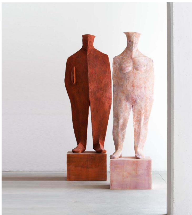
Wilhelm Senoner - Donna e uomo al semaforo

Figure simbolo, prese dalla massa, che rimandano a tipi universali, in cui l'umanità viene raffigurata.