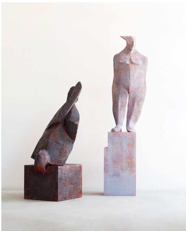
Wilhelm Senoner - Luce e ombra

Dopo l'installazione presso il Padiglione Italia di Torino in occasione della 54° Biennale d'Arte di Venezia, una nuova metafora della condizione umana rappresentata dal lavoro dell'artista altoatesino, presso le sale della Villa Raimondi sede della Fondazione Minoprio.