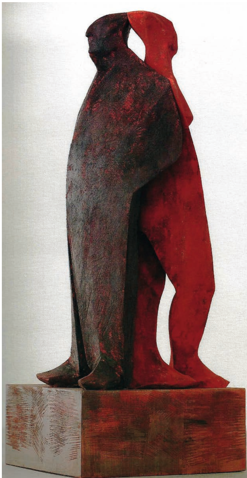
Senoner Wilhelm, Rücken an Rücken, 2014, Lindenholz, 2,30 hoch

Weiters wird es eine für Österreich sensationelle Sonderschau geben: „Live Performance – Francis Bacon Drawings & Wilhelm Senoner Sculptures“. Francis Bacon war der meistverkaufte und bekannteste Künstler des 20. Jahrhunderts. Seine Arbeiten wurden in Österreich bisher noch nie gezeigt. Die kontroversielle Gegenüberstellung mit den Skulpturen des Südtiroler Künstlers Wilhelm Senoner als zeitgenössisches Pendant zeigt ein spannungsgeladenes, überraschend reizvolles Zusammenspiel der künstlerischen Positionen auf.